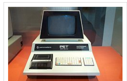
Octubre 1977: Commodore PET

Chuck Peddle diseñó el Commodore PET (abreviación de Personal Electronic Transactor) alrededor del procesador MOS 6502. Era esencialmente un computador de tarjeta única con un nuevo chip de exhibición de pantalla (el MOS 6545) que manejaba un pequeño monitor monocromático incorporado con gráficos de caracteres de 40x25. La tarjeta procesadora, el teclado, monitor y unidad de cassette estaban todos montados en una sola caja metálica. En 1982, Byte se refirió al diseño del PET como "el primer computador personal del mundo". [8]